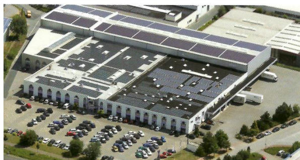
Centrala firmy Wortmann AG